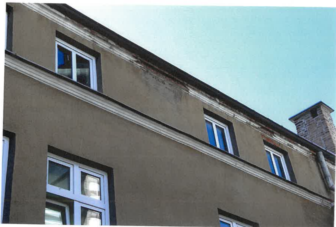
Fot. 17. Plebania z XVII wieku przy Kościele Farnym p. w. Św. Trójcy w Krośnie. Elewacja wschodnia skrzydła południowego z XX wieku – zbliżenie na ubytki gzymsu wieńczącego. Stan zachowania przed konserwacją w maju 2022 roku.