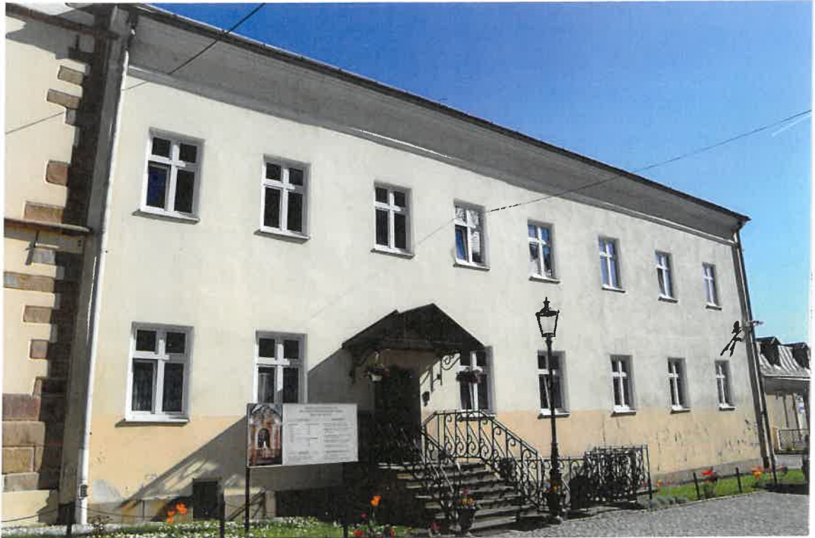
Fot. 1. Plebania z XVII wieku przy Kościele Farnym p. w. Św. Trójcy w Krośnie. Widok elewacji północnej od strony wschodniej. Stan zachowania przed konserwacją w maju 2022 roku.