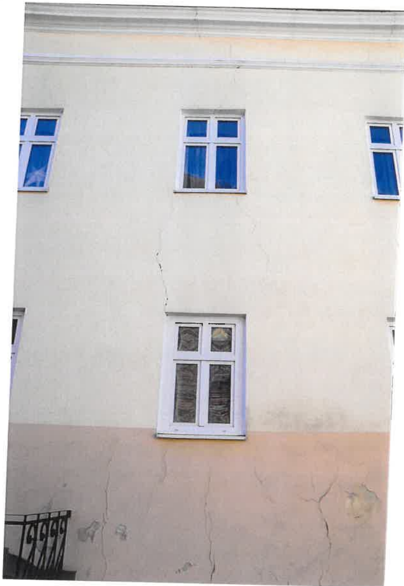
Fot. 7. Plebania z XVII wieku przy Kościele Farnym p. w. Św. Trójcy w Krośnie. Elewacja północna - zbliżenie na pęknięcia muru. Stan zachowania przed konserwacją w maju 2022 roku. Aut. fot. Hubert Lipka