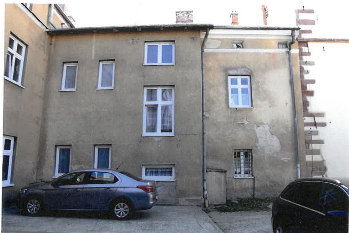
Fot. 11. Plebania z XVII wieku przy Kościele Farnym p. w. Św. Trójcy w Krośnie. Elewacja południowa. Stan zachowania przed konserwacją w maju 2022 roku.