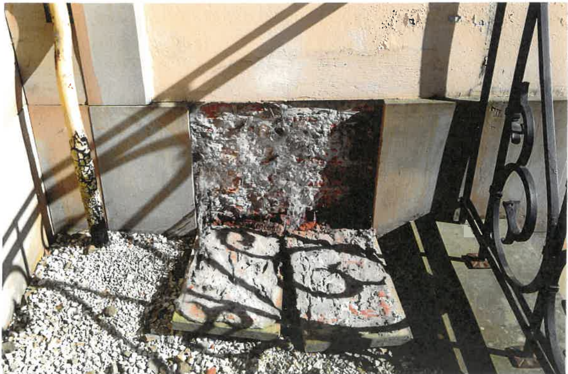
Fot. 9. Plebania z XVII wieku przy Kościele Farnym p. w. Św. Trójcy w Krośnie. Elewacja północna - zbliżenie na odpadający, licowany cokół z piaskowca. Stan zachowania przed konserwacją w maju 2022 roku.