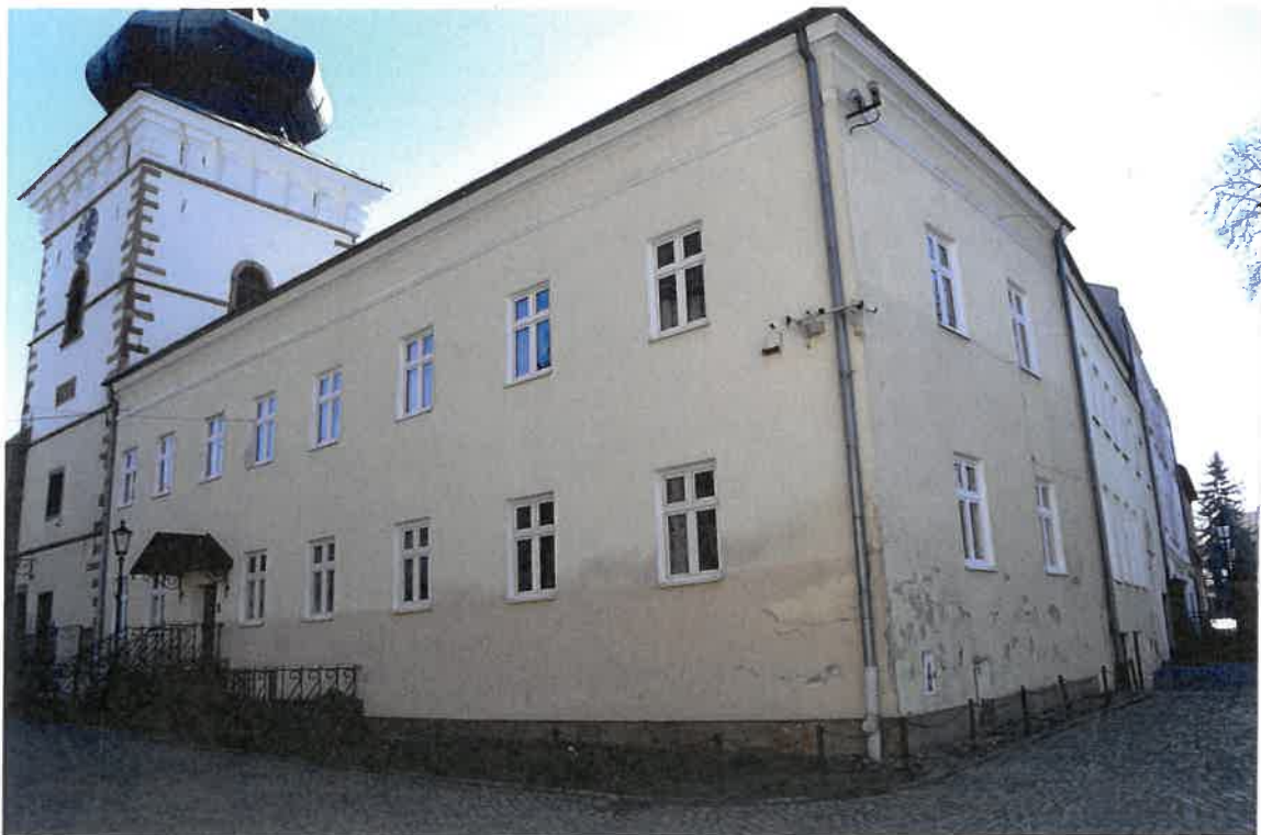
Fot. 2. Plebania z XVII wieku przy Kościele Farnym p. w. Św. Trójcy w Krośnie. Widok elewacji północnej od strony zachodniej. Stan zachowania przed konserwacją w maju 2022 roku.