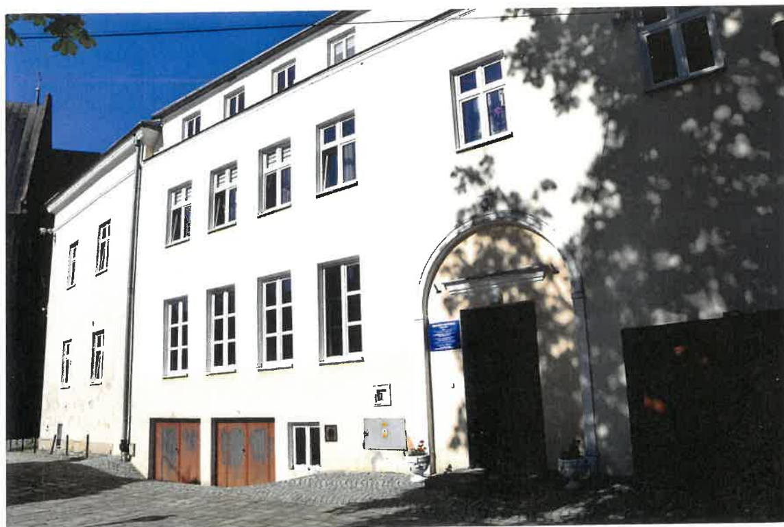
Fot. 4. Plebania z XVII wieku przy Kościele Farnym p. w. Św. Trójcy w Krośnie. Widok południowego skrzydła z XX wieku. Stan zachowania przed konserwacją w maju 2022 roku.