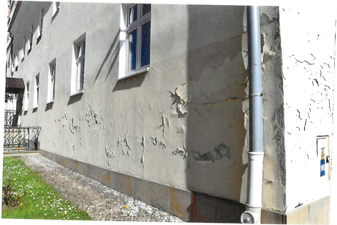
Fot. 5. Plebania z XVII wieku przy Kościele Farnym p. w. Św. Trójcy w Krośnie. Elewacja północna - zbliżenie na rozwarstwiający się tynk. Stan zachowania przed konserwacją w maju 2022 roku.