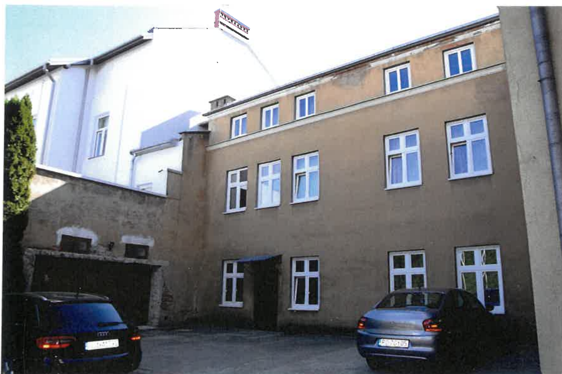
Fot. 14. Plebania z XVII wieku przy Kościele Farnym p. w. Św. Trójcy w Krośnice. Widok skrzydła południowego wraz pomieszczeniem gospodarczym. Stan zachowania przed konserwacją w maju 2022 roku.