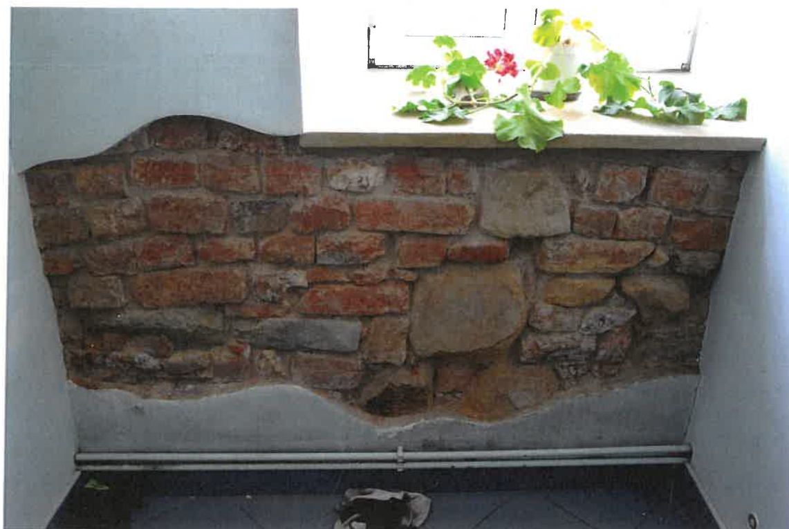
Fot. 23. Plebania z XVII wieku przy Kościele Farnym p. w. Św. Trójcy w Krośnie. Mur elewacji północnej – wnętrze budynku. Stan zachowania przed konserwacją w maju 2022 roku.