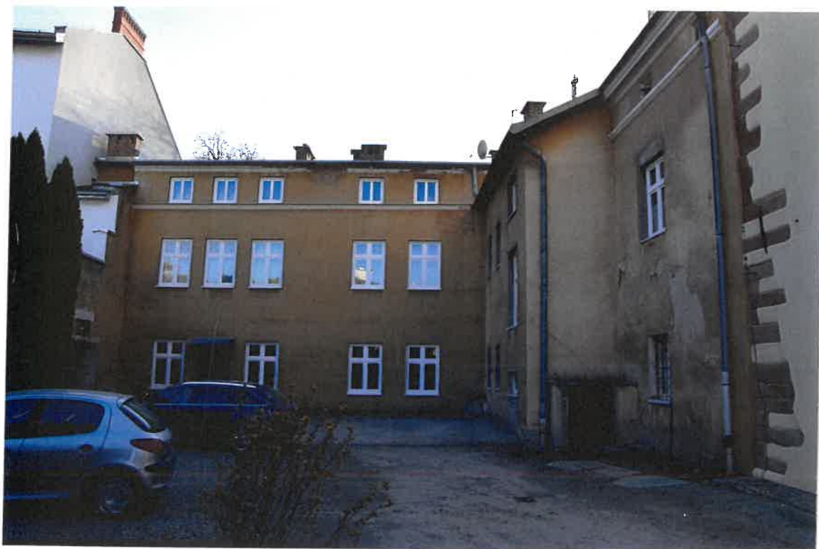
Fot. 10. Plebania z XVII wieku przy Kościele Farnym p. w. Św. Trójcy w Krośnie. Widok plebani od strony użytkowego dziedzińca. Stan zachowania przed konserwacją w maju 2022 roku.