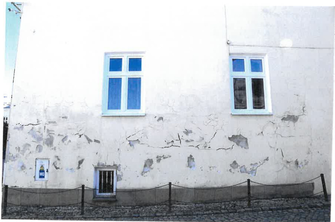
Fot. 6. Plebania z XVII wieku przy Kościele Farnym p. w. Św. Trójcy w Krośnie. Elewacja wschodnia - zbliżenie na rozwarstwiający się tynk. Stan zachowania przed konserwacją w maju 2022 roku.