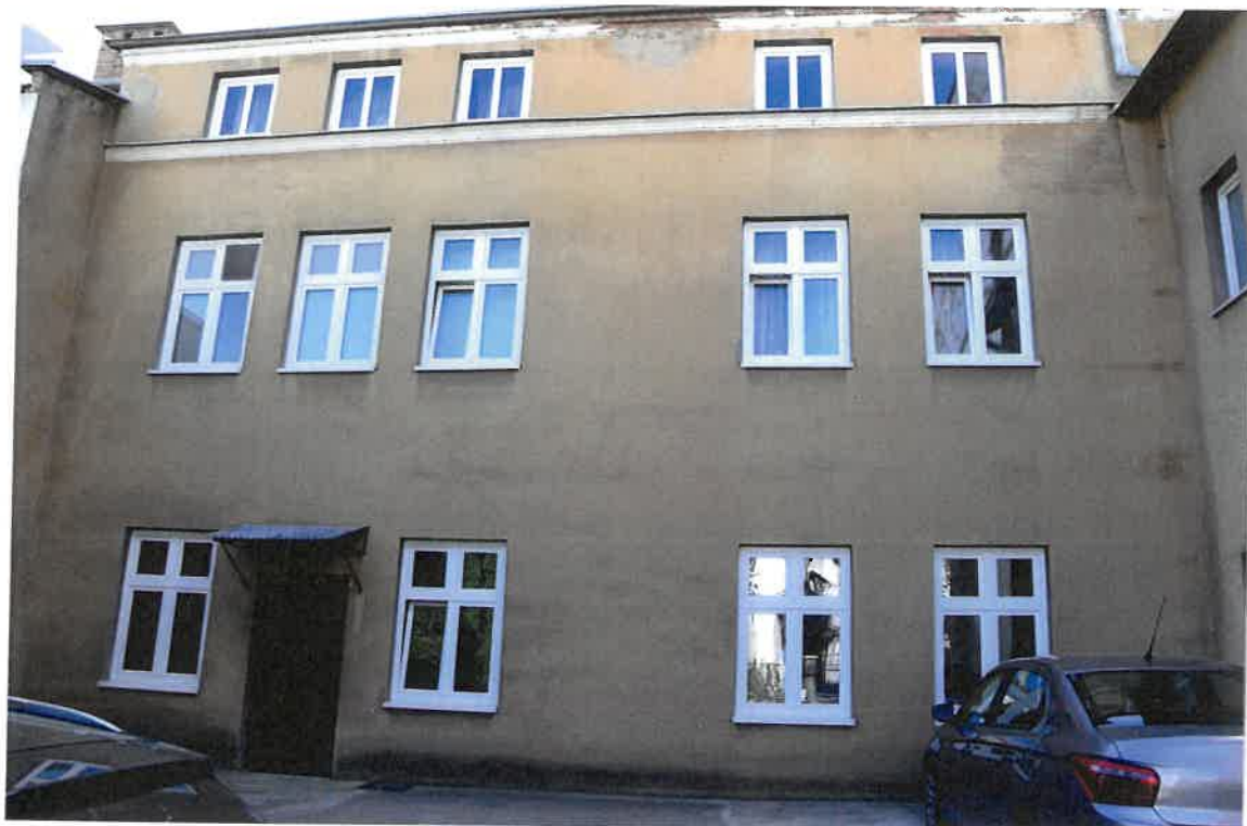
Fot. 15. Plebania z XVII wieku przy Kościele Farnym p. w. Św. Trójcy w Krośnie. Elewacja wschodnia skrzydła południowego z XX wieku. Stan zachowania przed konserwacją w maju 2022 roku.