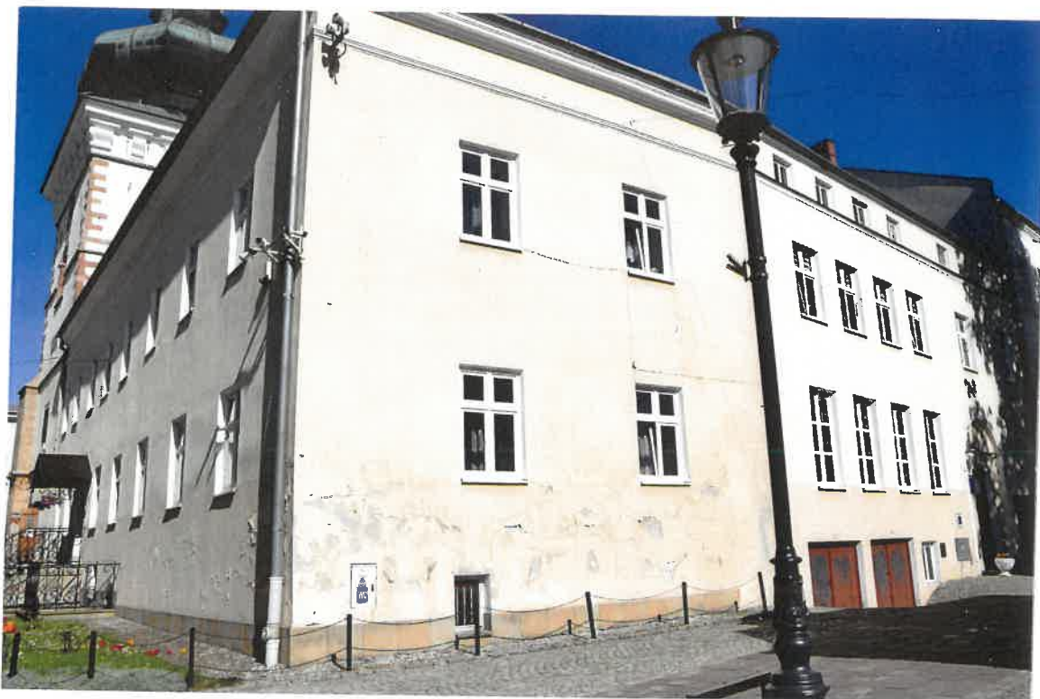
Fot. 3. Plebania z XVII wieku przy Kościele Farnym p. w. Św. Trójcy w Krośnie. Widok elewacji zachodniej wraz z południowym skrzydłem z XX wieku. Stan zachowania przed konserwacją w maju 2022 roku.