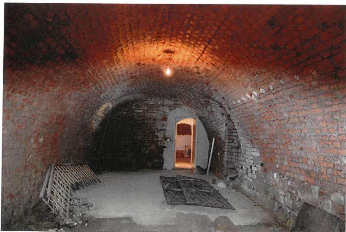
Fot. 22. Plebania z XVII wieku przy Kościele Farnym p. w. Św. Trójcy w Krośnie. Piwnica starej plebanii ujęcie w kierunku zachodnim. Stan zachowania przed konserwacją w maju 2022 roku.