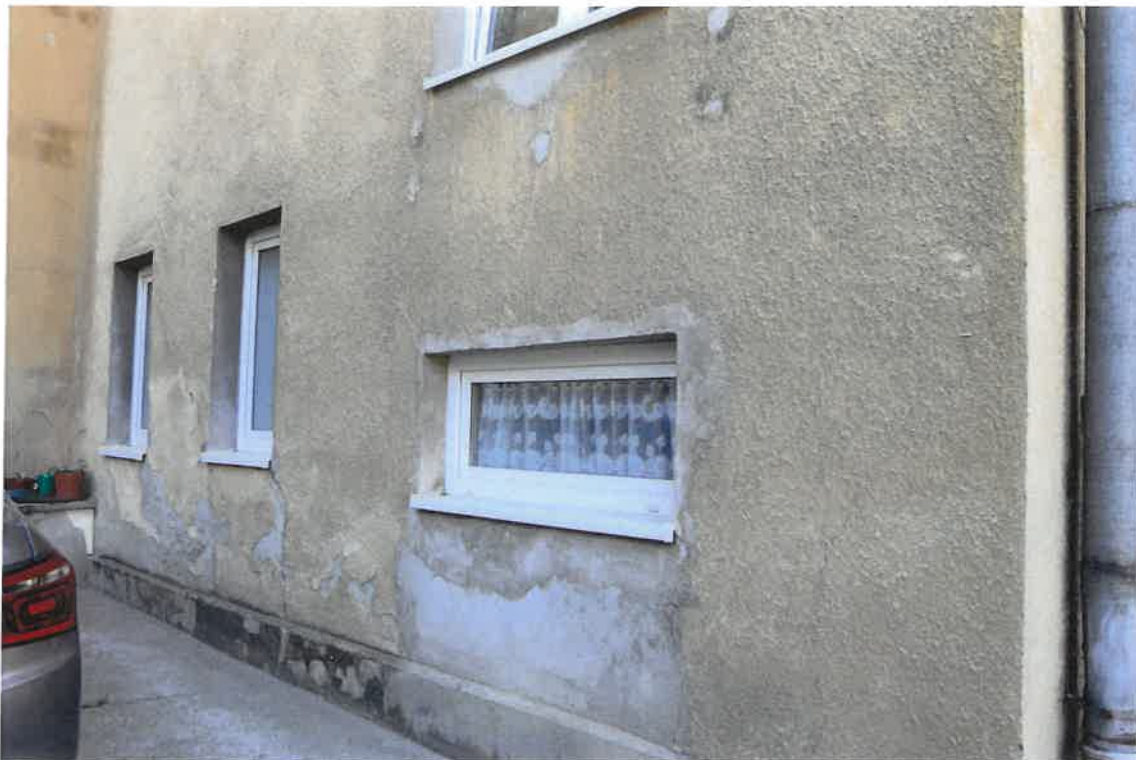
Fot. 13. Plebania z XVII wieku przy Kościele Farnym p. w. Św. Trójcy w Krośnice. Zbliżenie na cokół ryzalitu elewacji południowej. Stan zachowania przed konserwacją w maju 2022 roku.