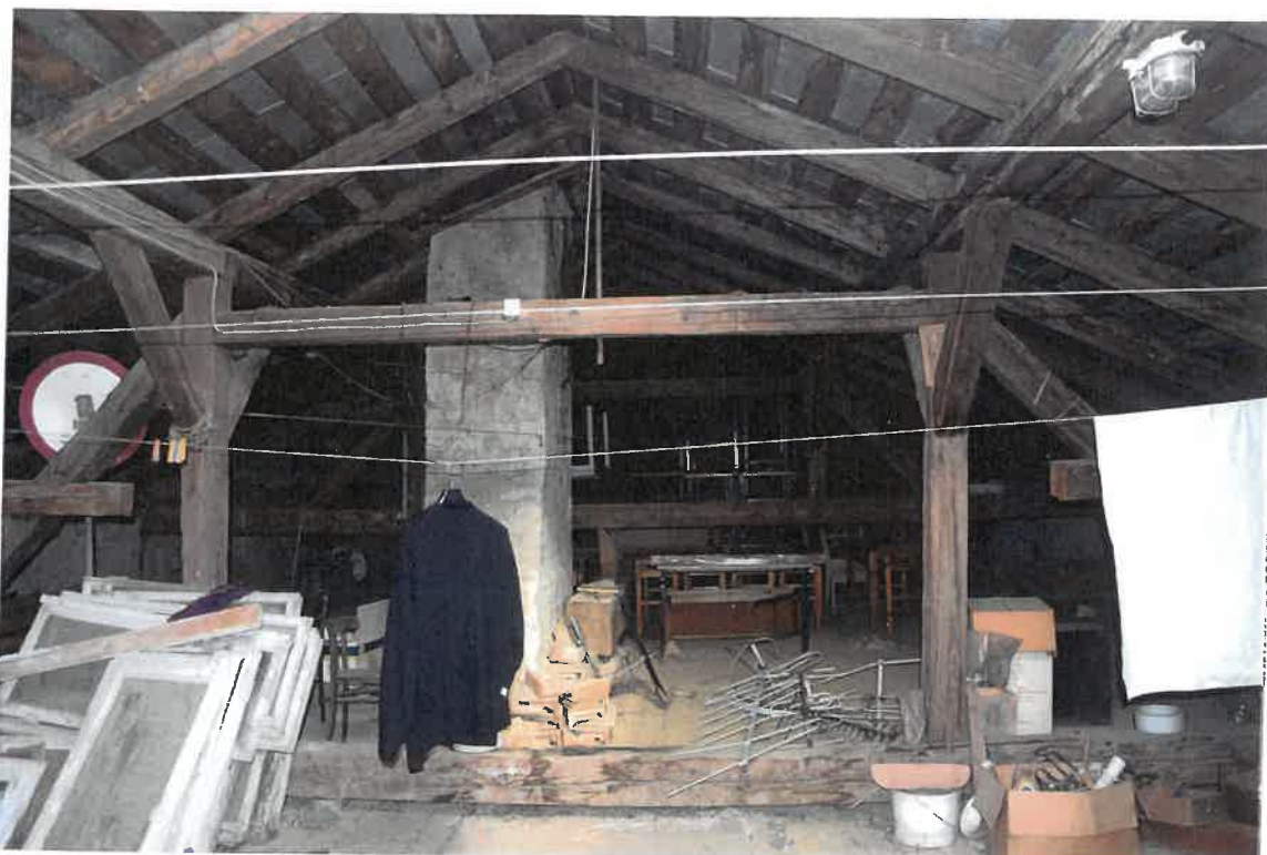
Fot. 19. Plebania z XVII wieku przy Kościele Farnym p. w. Św. Trójcy w Krośnie. Więźba dachowa starej plebanii. Ujęcie w kierunku wschodnim. Stan zachowania przed konserwacją w maju 2022 roku. Aut. fot. Hubert Lipka