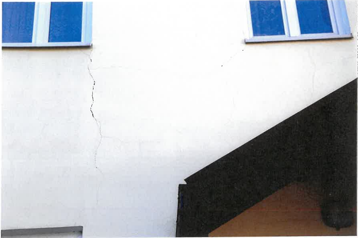
Fot. 8. Plebania z XVII wieku przy Kościele Farnym p. w. Św. Trójcy w Krośnie. Elewacja północna - zbliżenie na pęknięcia muru. Stan zachowania przed konserwacją w maju 2022 roku.