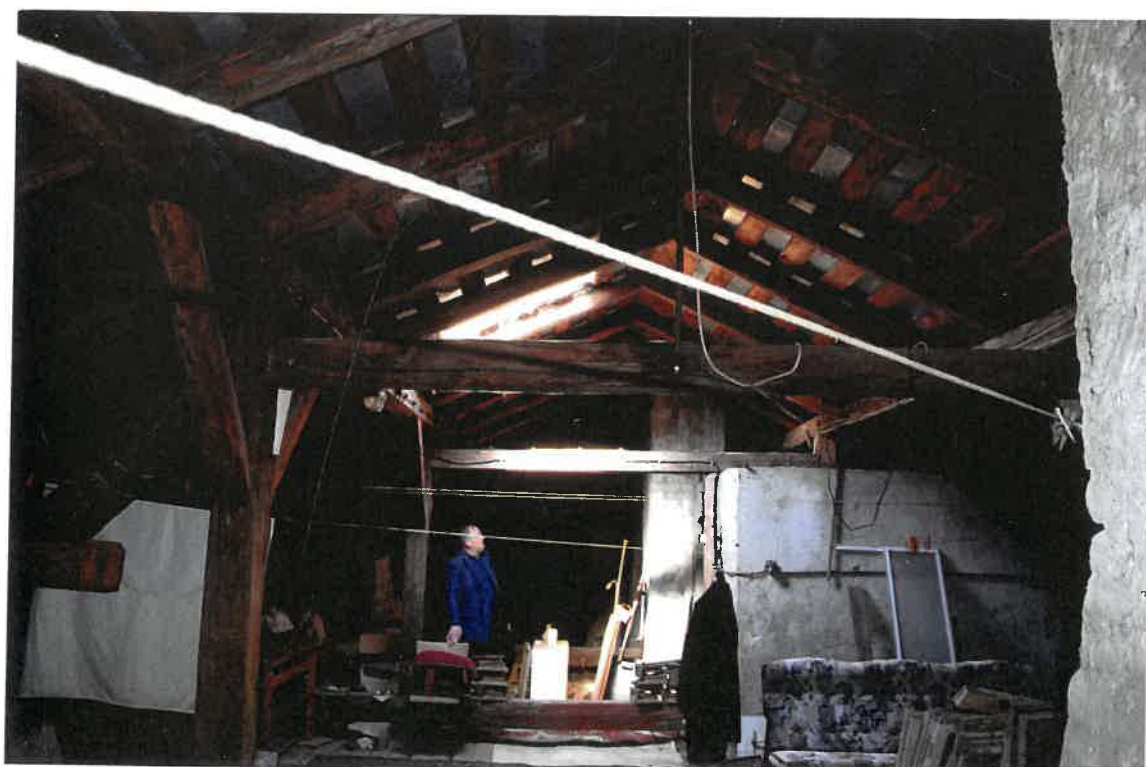
Fot. 18. Plebania z XVII wieku przy Kościele Farnym p. w. Św. Trójcy w Krośnie. Więźba dachowa starej plebanii. Ujęcie w kierunku zachodnim. Stan zachowania przed konserwacją w maju 2022 roku.