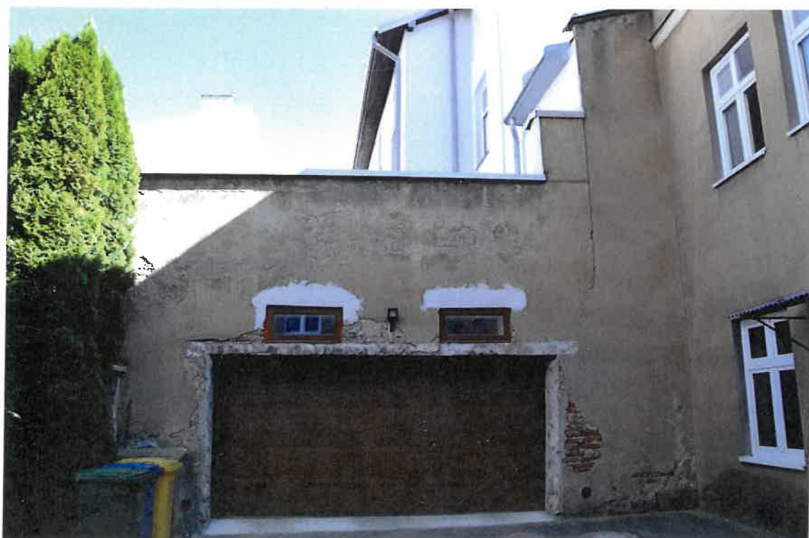
Fot. 16. Plebania z XVII wieku przy Kościele Farnym p. w. Św. Trójcy w Krośnie. Pomieszczenie gospodarcze. Stan zachowania przed konserwacją w maju 2022 roku.