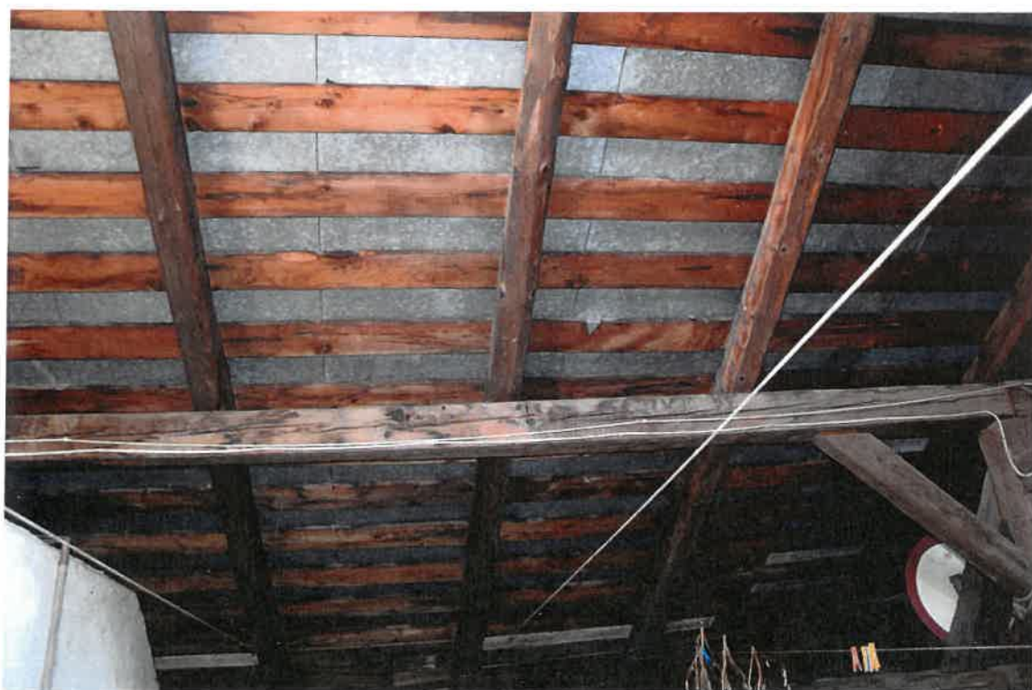
Fot. 20. Plebania z XVII wieku przy Kościele Farnym p. w. Św. Trójcy w Krośnie. Więźba dachowa starej plebanii. Zbliżenie na fragment połaci dachowej. Stan zachowania przed konserwacją w maju 2022 roku.