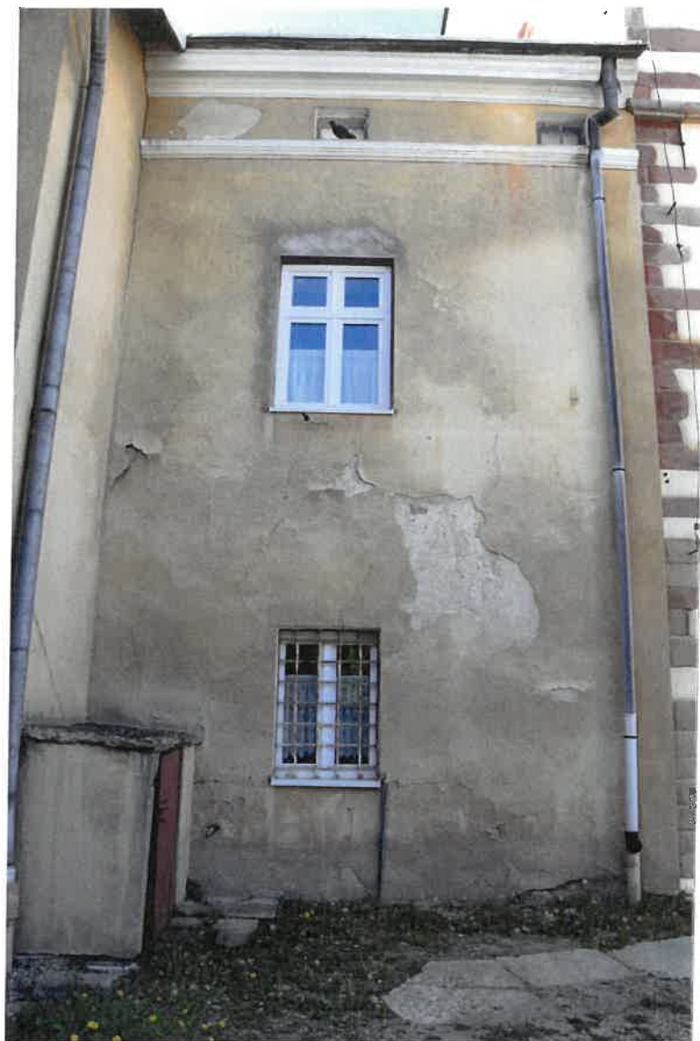
Fot. 12. Plebania z XVII wieku przy Kościele Farnym p. w. Św. Trójcy w Krośnice. Elewacja południowa – prawa strona. Stan zachowania przed konserwacją w maju 2022 roku.